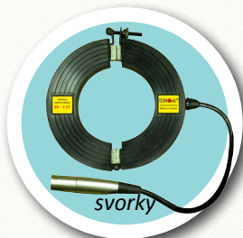
CI - 117 Indukční kleště