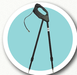
DKI - 117 Senzor pro kontrolu izolace