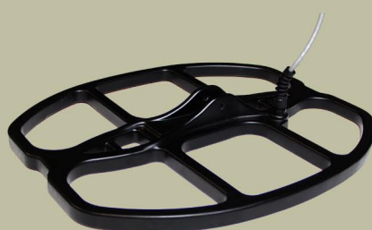
38x30 cm 2D