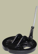
12 cm 2D Spider

LP ZERO je dodáván v základní verzi se dvěma typy sond 23 cm 2D Spider a 30 cm 2D Spider. K dispozici je ale celá řada dalších sond vyráběných pro LP ZERO jak společností Golden Mask, tak firmou Detech.