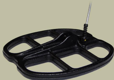
30x25 cm 2D