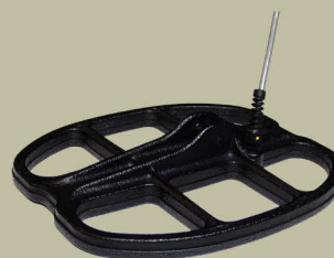
25x23 cm 2D