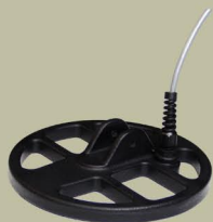
17 cm 2D Spider