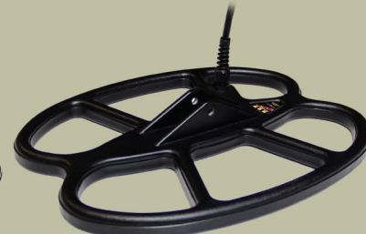
30x25 cm 2D S.E.F.