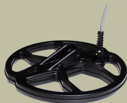
23 cm 2D Spider