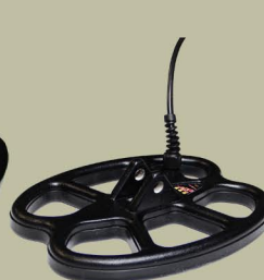
20x15 cm 2D S.E.F.