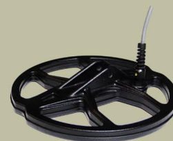
Sonda 23 cm 2D Spider