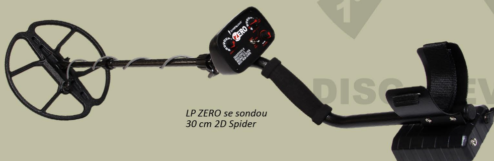
LP ZERO se sondou 30 cm 2D Spider

Možnost nahradit bateriemi: Ano, 1,5V AA