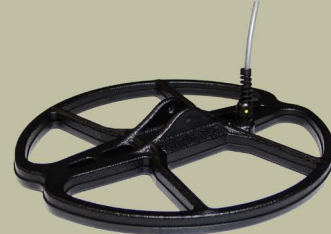
30 cm 2D Spider