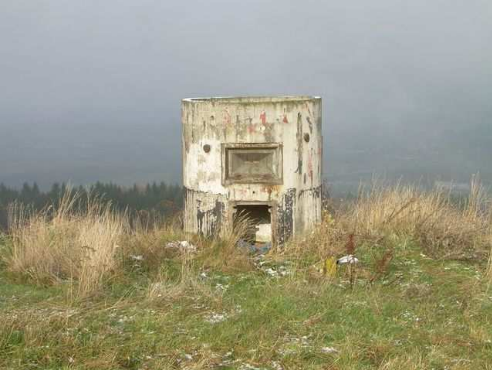
Válcová pozorovatelna Civilní obrany v lokalitě Sokolov-Novina.