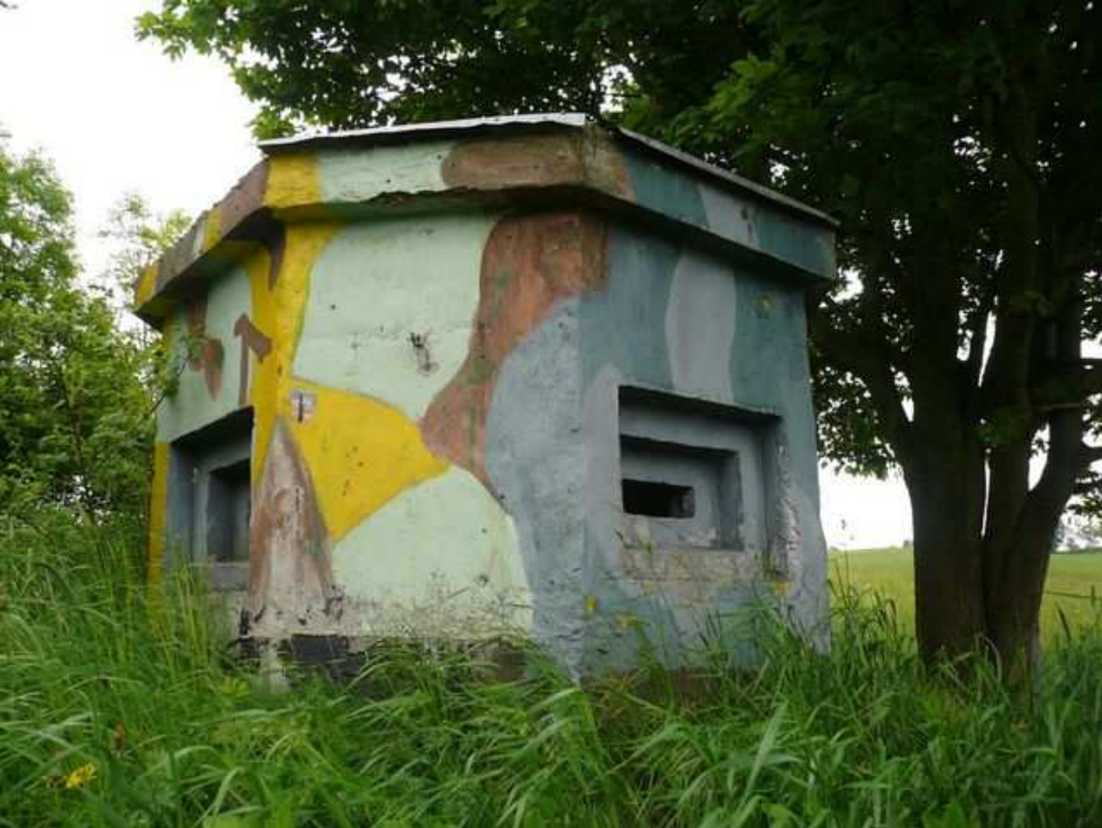
Oktagonální pozorovatelna Civilní obrany nad Náchodem.